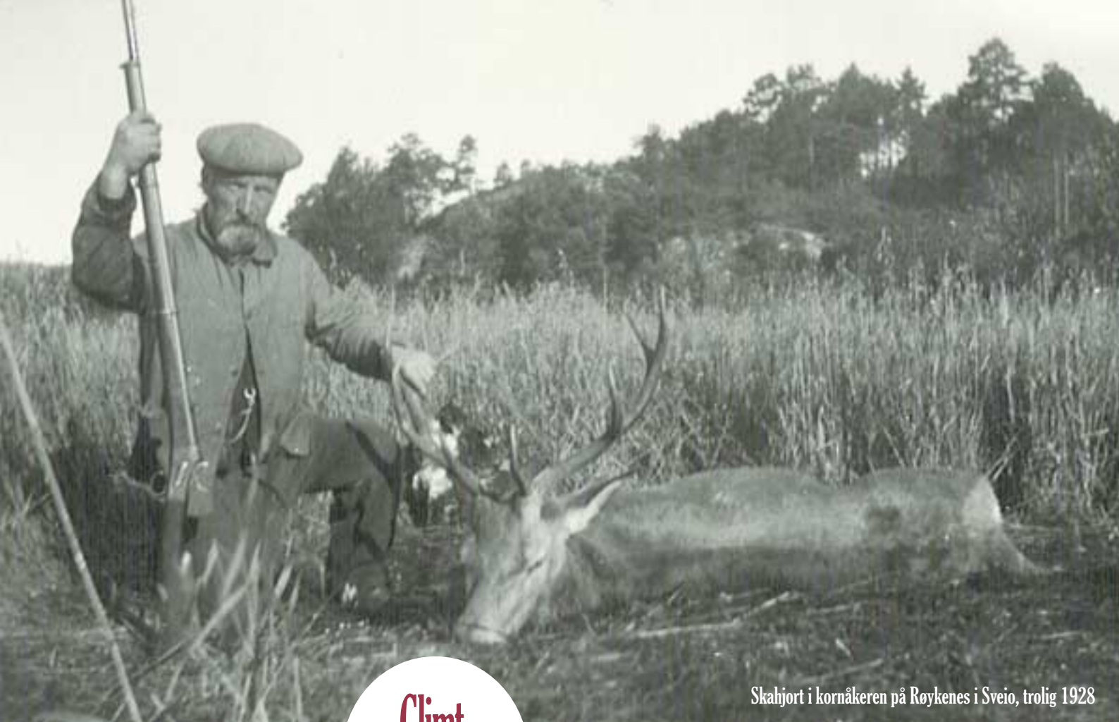
Skahjort i kornåkeren på Røykenes i Sveio, trolig 1928