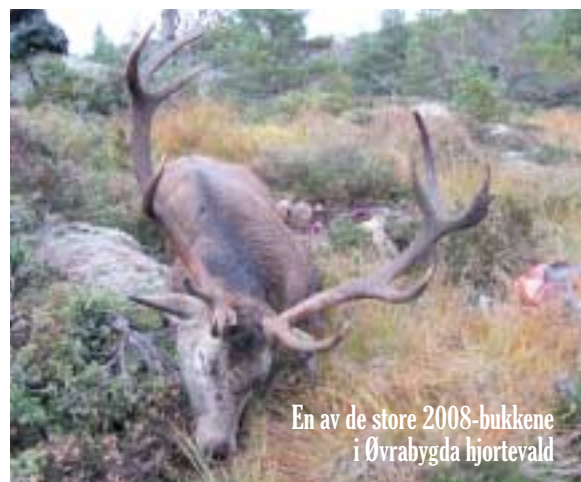
En av de store 2008-bukkene i Øvrabygda hjortevald