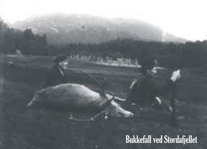
Bukkefall ved Stordafjellet