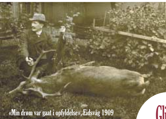
«Min drøm var gaat i oppfylldelse», Eidsvåg 1909